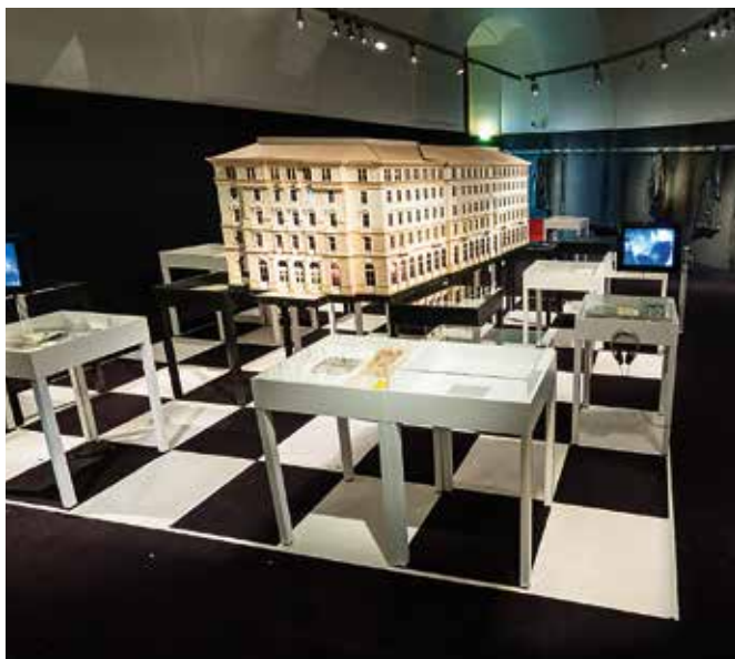
Das Wiener Hotel Métropole – Blick in den Ausstellungsraum