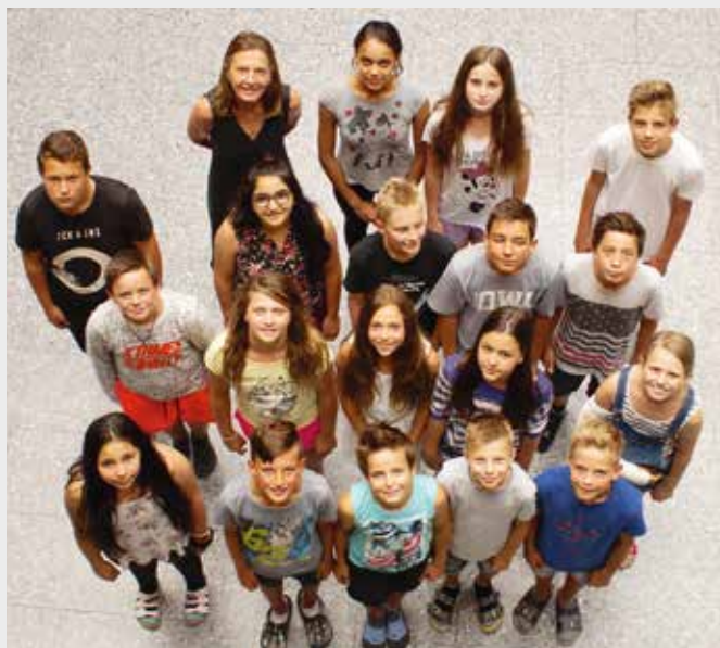
Schülerinnen und Schüler der Klasse 2 b