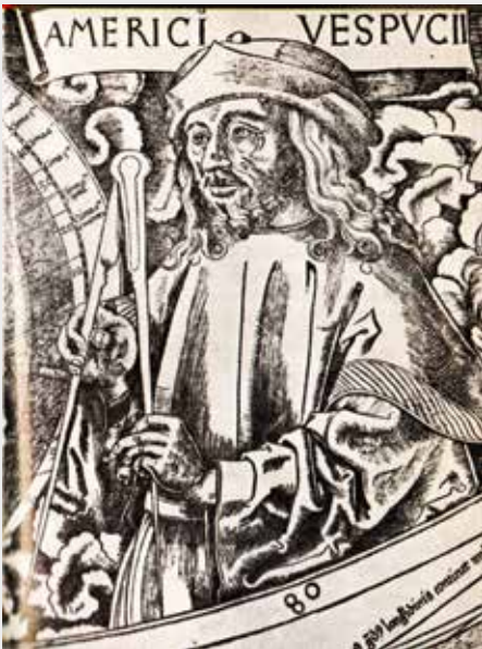
Amerigo Vespucci, Teil der Weltkarte von Waldeseemüller, 1507