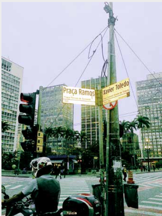
São Paulo, an der Praça Ramos de Azevedo